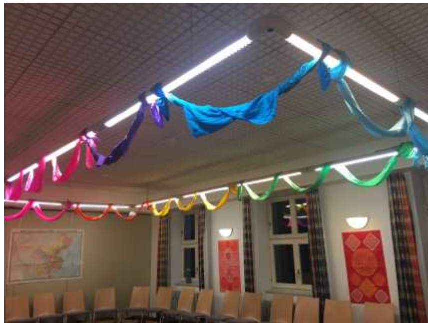
(利用中國彩帶及剪紙教室布置)