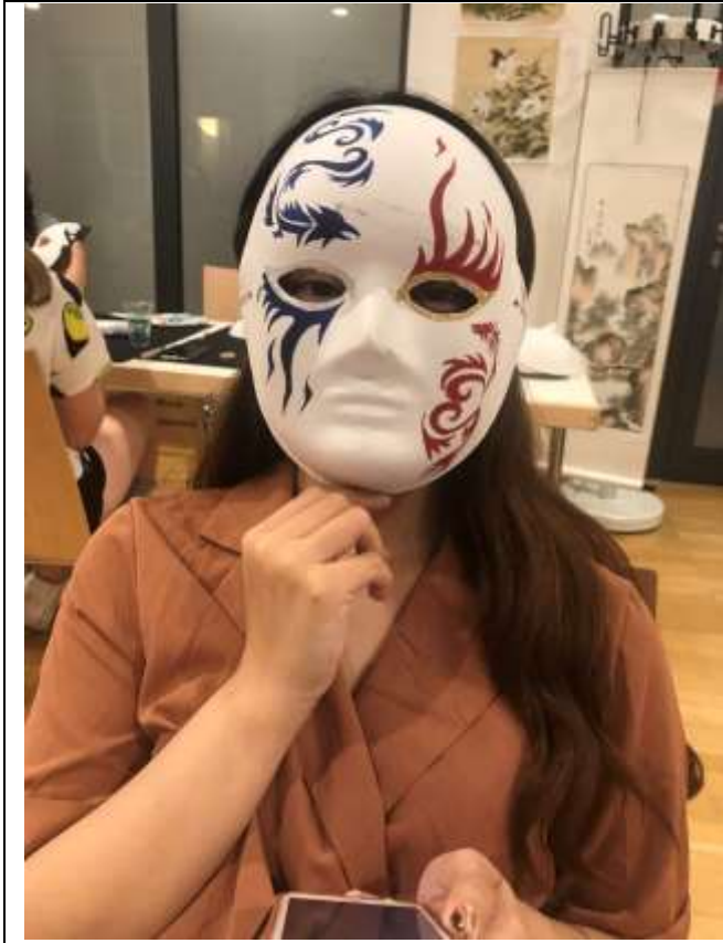
(與學生一起製作京劇臉譜)