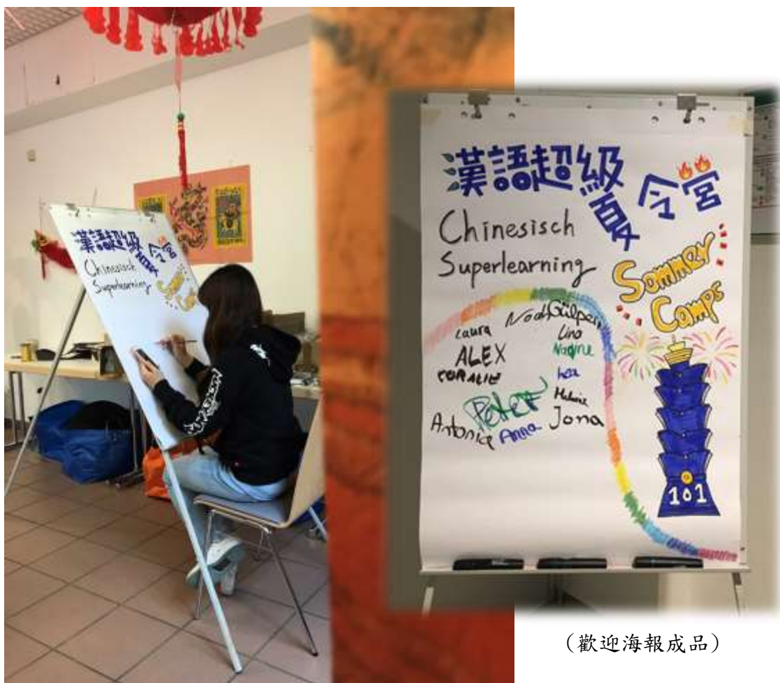
(課前繪製歡迎海報)

且在這一個月的實習期間，與德國學生朝夕相處，不僅學了許多德語，也學到了許多文化間的差異，最讓我感到衝擊的是，他們用手指比數字的方式居然跟我們台灣人不同，如：我們想要用手指比出一的時候，我們使用的會是食指，但德國人卻是拇指，其他數字呈現方式也不同，所以一開始在教聲調的時候，我會使用手指輔助告訴他們這個字應該是什麼聲調，結果發現他們都不太能理解我手比出來的數字，後來是有位學生問我那是什麼意思，我們互相解釋後才恍然大悟，所以這次的實習經驗不僅讓我學到了如何用輕鬆有效的方式教導學生，更讓我認識了文化間的差異可以微小到我們不曾注意的地方，所以這讓我更懂得如何去面對及尊重跨文化的差異。