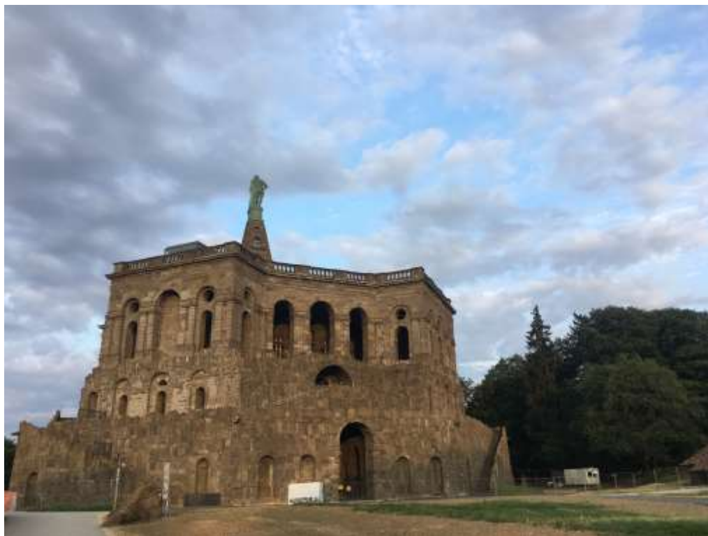
(德國卡賽爾海克力士公園)