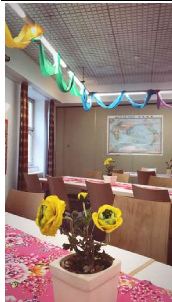
(利用臺灣花布教室布置)