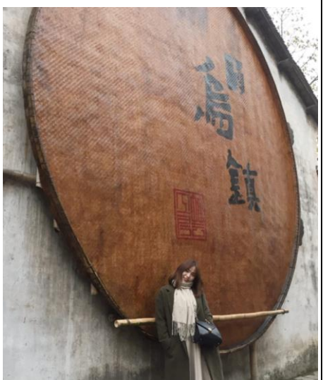
上海交通大學交流-參訪烏鎮