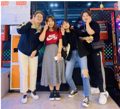
跟韓國朋友們一起出去玩