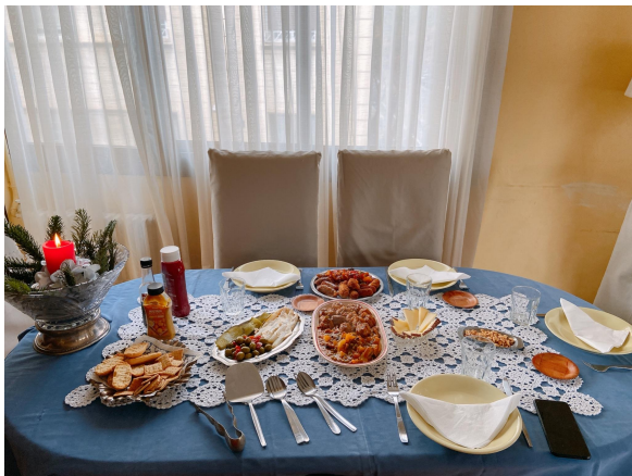
到西班牙室友家作客