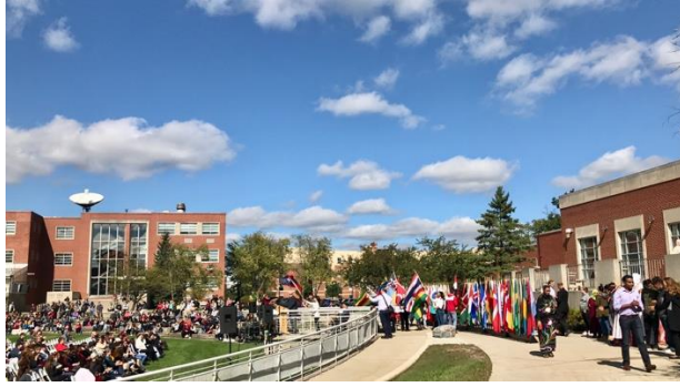
圖為國際學生揮舞各國國旗