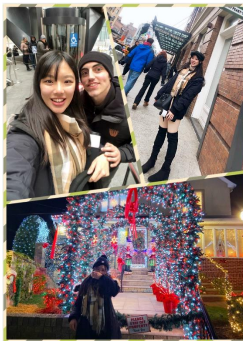
Thousand yard vessel (左上)、Chelsea market (右上)、Dyker Heights Christmas Lights (下)