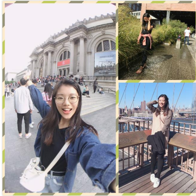
The Met (左)、The High Line (右上)、Brooklyn bridge (右下)