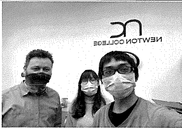
和 Newton College 老師見面