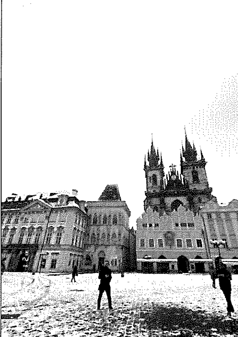
下雪的布拉格廣場