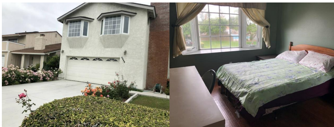
左圖，宿舍房屋外觀。/右圖，我們的房間。