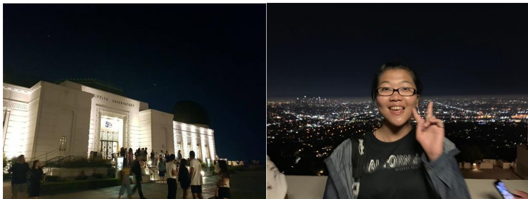
左圖，Griffith 天文台。/右圖，在天文台上俯瞰的夜景。

我們到洛杉磯遊玩了三次，其中兩次是自己搭火車，一次由學校的老師開車帶我們去玩，到了著名電影 LA LA LAND 的場景 Griffith Observatory，在那裡看到了 LA 美麗的夜景。