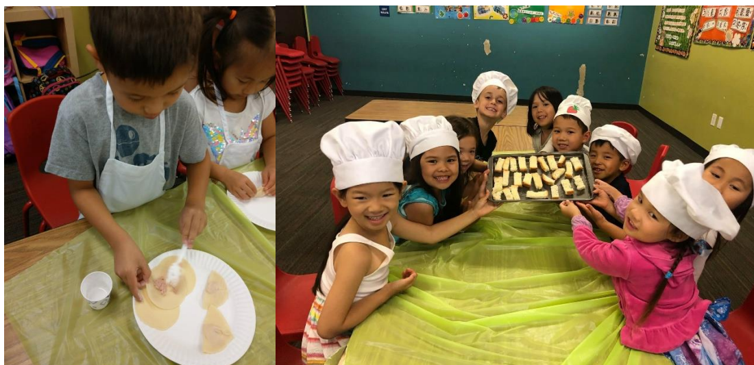
左圖，孩子細心的將料放上餃皮。/右圖，大家共同製作甜點，蜜糖吐司。