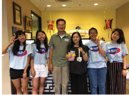
左圖，當地老師帶我們一同去吃飯。/右圖，我們製作小禮物送予校長。

我也向她們學習到很多，不管是實際的技能或是工作心態。我在經過這次的實習之後，除了在幼教方面累積了現場實務經驗、課程規劃以及應對能力，也讓我找到了幼教之外感興趣的領域，華語文教育。期待能以這次的實習作為開端的契機，將來能朝向自己的目標邁進。