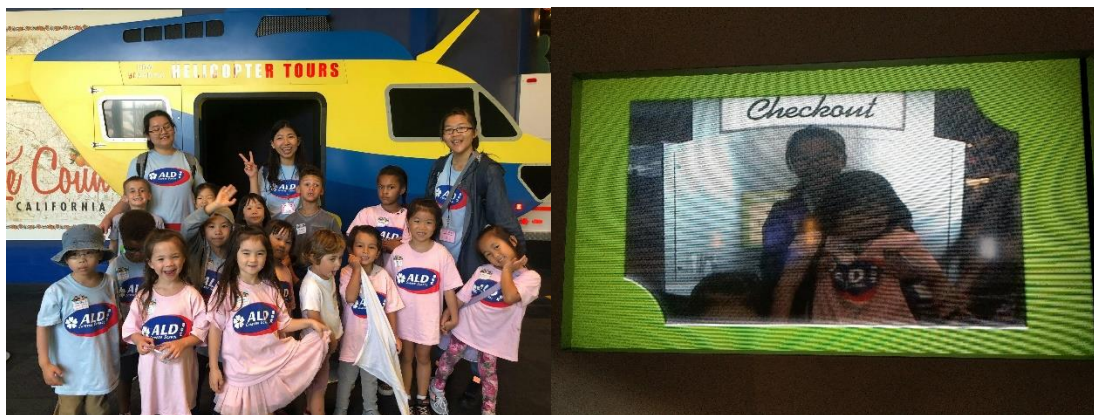
左圖，Beginner A 大合照。/右圖，在博物館的遊戲關卡後的紀念照。

這次的校外教學是整天的活動，全校師生一同出動，因為 Beginner A 的學生年紀略小，因此安排了三位老師一同看護，但一路上我還是提心吊膽，生怕有哪個學生走丟了。所幸最後平安結束了這天的行程。Discovery Science Center 有許多互動式的裝置，讓孩子在玩樂體驗中認識許多知識，不像一般印象中，有許多理論告示牌的博物館，也讓我在其中開了眼界。