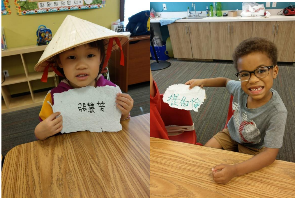
上圖，孩子將自己的中文名字寫在自製的手工紙上面。