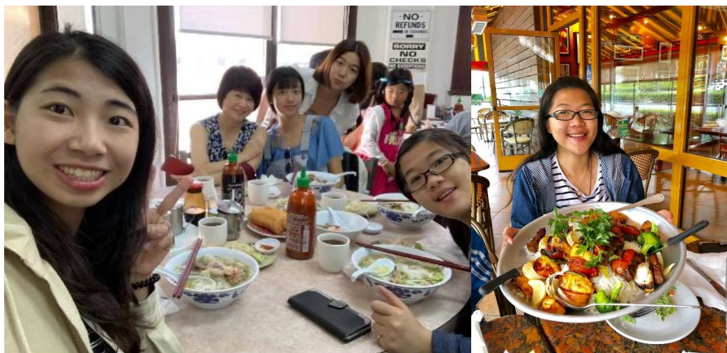
左圖，我們去小西貢區吃潮州粿條。/右圖，美味的地中海料理。

在美國，老師們都十分照顧我們，帶著我們，嘗遍了各式各樣的美味食物。美國不愧是一個族群融合的國家，美食也非常多元。