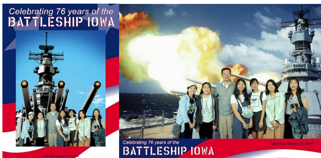
上圖，我們在戰艦上所拍之紀念照。

在美國的最後一天，我們來到了戰艦博物館參觀，由校長為我們講解船上的歷史，在大開眼界的同時，也學習到了不少歷史知識。