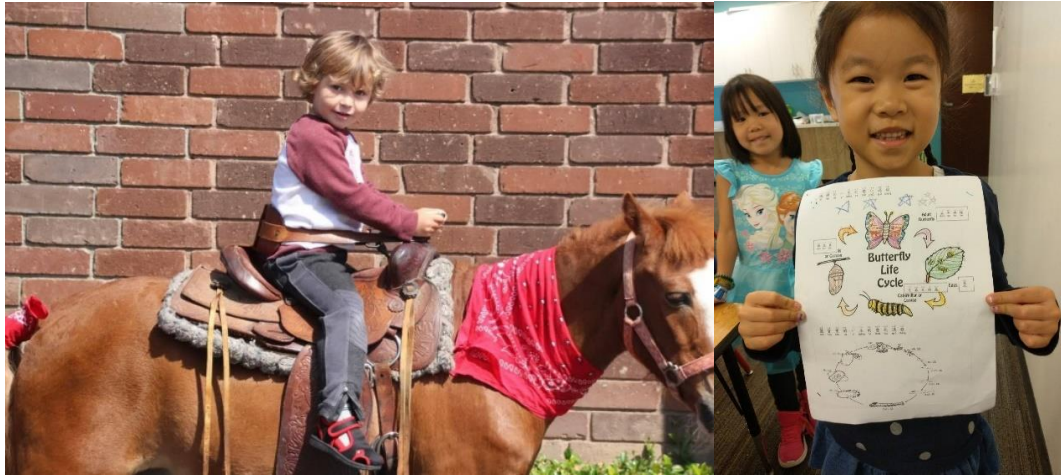
左圖，孩子騎小馬體驗。/右圖，孩子繪製動物的生命週期圖。