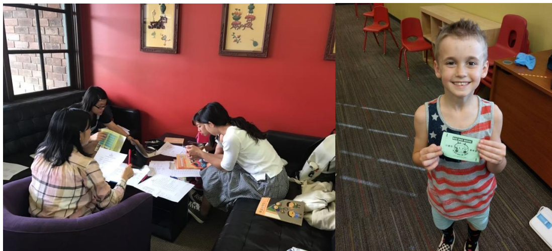
(圖二)左圖，與校長初次開會。/右圖，學校當地的獎勵制度，Boo Boo 錢。

我們參加的是小時代中文學校的暑期營隊，營隊的課程內容非常豐富，每週都有不同的主題與課程。我們在行前的視訊會議時便有聽老師粗略介紹，六月十七初次到小時代學校參觀，與老師開了個會，初步了解我們要帶的班級及課程流程。