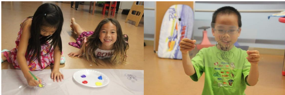
左圖，孩子使用顏料畫動畫分鏡。/右圖，孩子將動畫圖片畫在透明板上。

第一個禮拜的主題活動時間，學校請來了皮克斯動畫的動畫從業人員，教導孩子們與動畫有關的小技巧與繪畫。