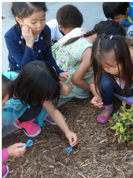
左圖，孩子與可愛動物們接觸。/右圖，孩子們在戶外尋找昆蟲的蹤影。