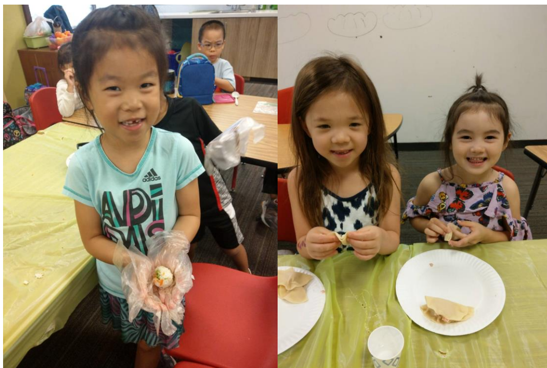
左圖，孩子與她捏的飯糰。/右圖，孩子們一同包水餃。

這鐵定是我們班的孩子最難忘的一週。在這個禮拜，我們學習各種食物的中文名稱，蔬菜水果等。這個禮拜的主題活動時間，就是讓孩子們親手做料理，我們體驗了包水餃、捏飯糰，自製墨西哥捲餅以及披撒。而在週四有甜點大賽，我們先事前讓孩子們投票決定我們班要做什麼，再一起完成我們的甜點。所有孩子都非常看重這次的比賽，最後獲得冠軍時開心地都快哭了。也成為我與共同帶班的 Sandy 老師一個非常難忘的回憶。