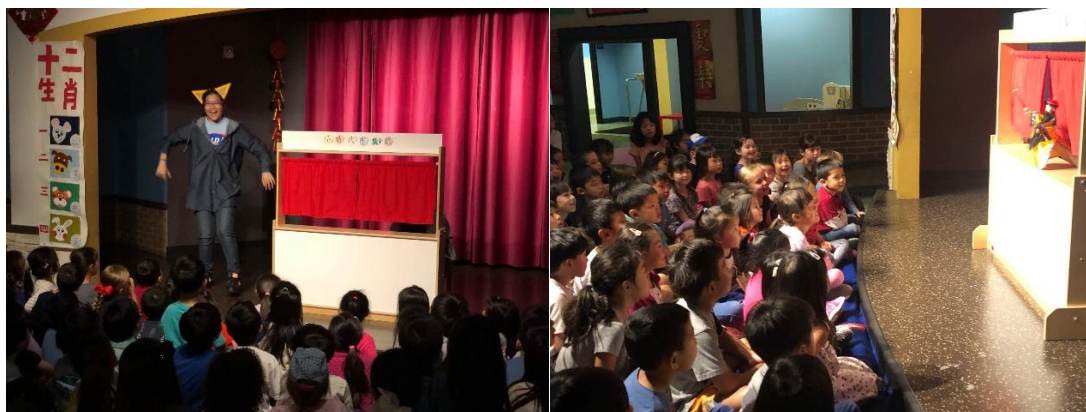
左圖，最後結局，貓咪跳出來伸冤。/右圖，玉皇大帝宣布舉辦十二生肖選拔。

我們演出了十二生肖中，《貓捉老鼠》的故事，略作改編，讓貓咪的角色由真人飾演，增加最後環節的互動性。我在其中飾演貓咪與操偶豬及老虎。