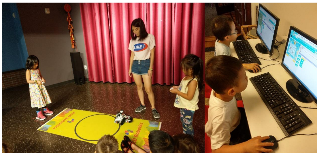
左圖，孩子進行機器人競賽。/右圖，在電腦教室練習運算思維 Hour of Code