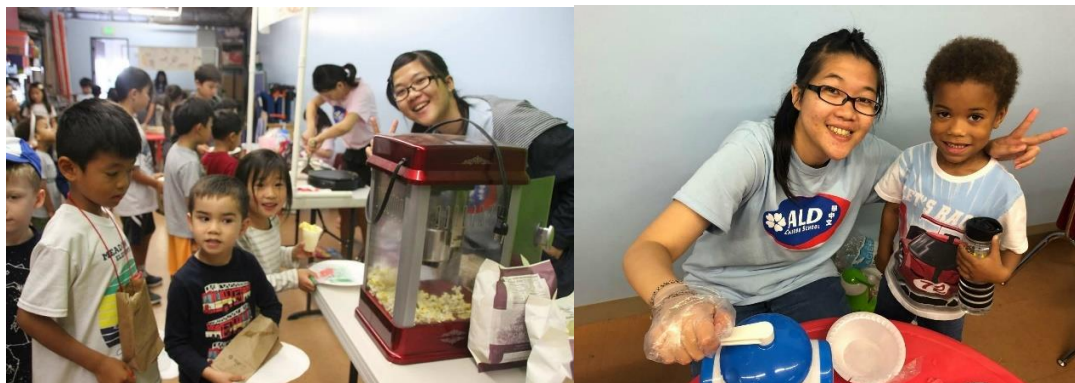
左圖，為我在夜市負責爆米花攤位。/右圖，在剉冰攤位，正在剉冰給孩子們。

夜市是台灣的特色之一，我們在學校進行夜市擺攤，並在中文課程中教導孩子夜市相關的中文口說，讓孩子在好玩又能吃吃喝喝的真實夜市情境中練習中文。