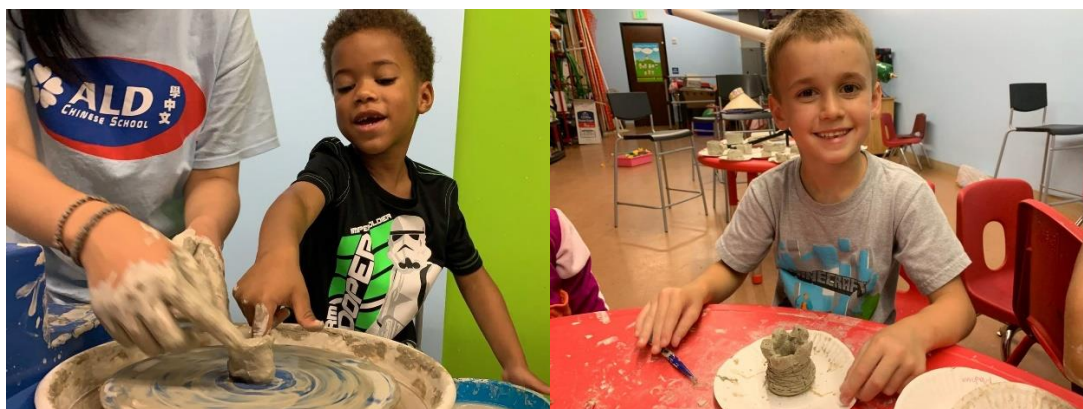
上圖，孩子製作自己的手工陶土作品。

而主題活動時間，我們與孩子一起製作手工紙，並告訴他們蔡倫造紙的故事。在捏製陶土的那天，觀賞了鶯歌製陶的影片。