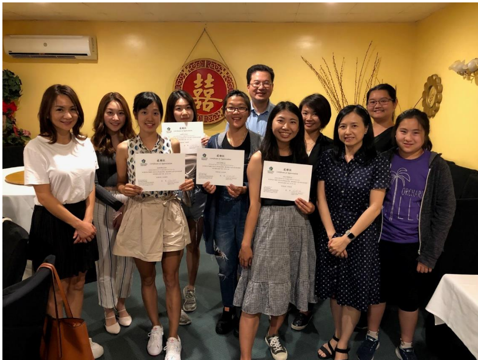
上圖，最後的送別會與證書發放。

感謝教育部給予我們這樣難能可貴的機會，讓我們能夠到異國體驗與成長，甚至讓我有了更多的生涯規劃，獲得了許多寶貴的經驗。這些在美國的成長與經歷，我會存放在心中，成為一生美好的回憶。