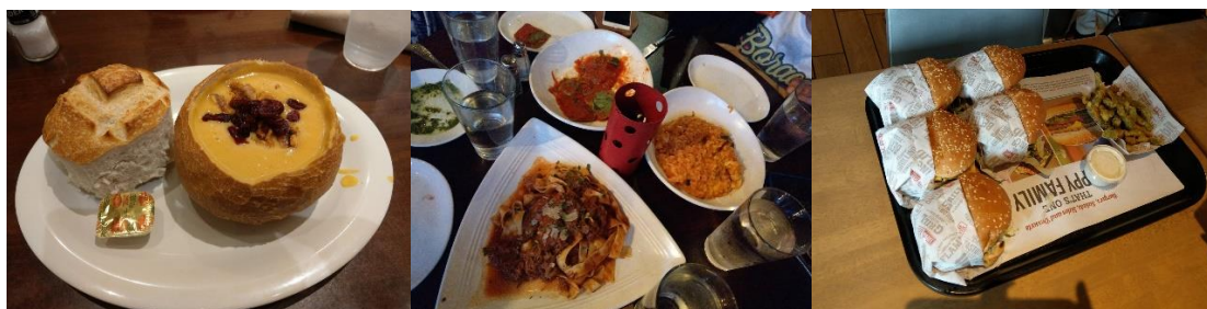
左圖，LA 著名的酸麵包濃湯。/中圖，義式料理。/右圖， In' n Out 連鎖店。