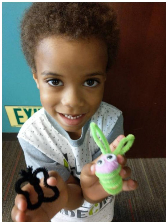
左圖，孩子與紙袋偶成品。/右圖，孩子與毛根手指偶成品。