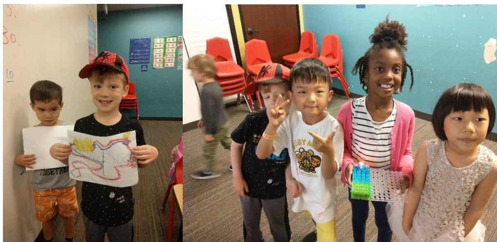
左圖，孩子畫出電路。/右圖，樂高作為電線，組成電路板，成功讓燈泡亮起。

檢視孩子們的圖案能不能形成正確的迴路，並且要留有折線開關，不能讓孩子自由亂畫。在學姊的指導後，最後我們班終於成功完成實驗。