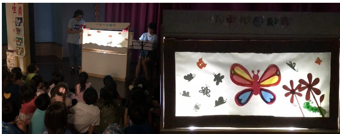
左圖，《龜兔賽跑》，以卷軸方式進行換幕。/右圖，《袋子裡的怪獸》