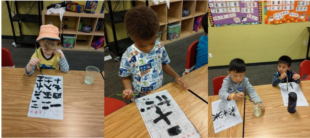
(圖三)在傳統文化課程中練習書法的孩子們