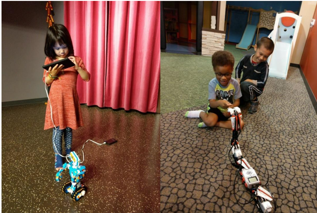
左圖，孩子自己操作人形機器人。/右圖，孩子與蛇行機器人互動。

台灣近幾年也在推行科技融入教學，而讓孩子體驗操作機器人是最好玩的方式，我們先帶孩子到電腦 Hour of code 練習運算思維，再讓孩子操作機器人。