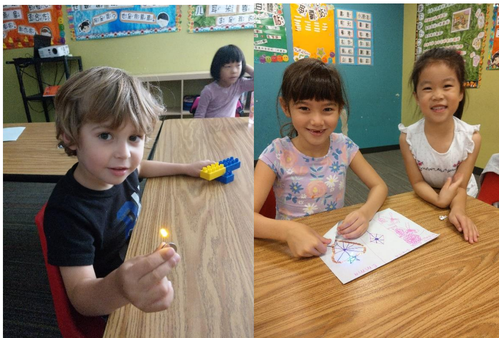
左圖，銅線實驗未成功，只好先以燈泡接電池。/右圖，銅線膠帶實驗成功。