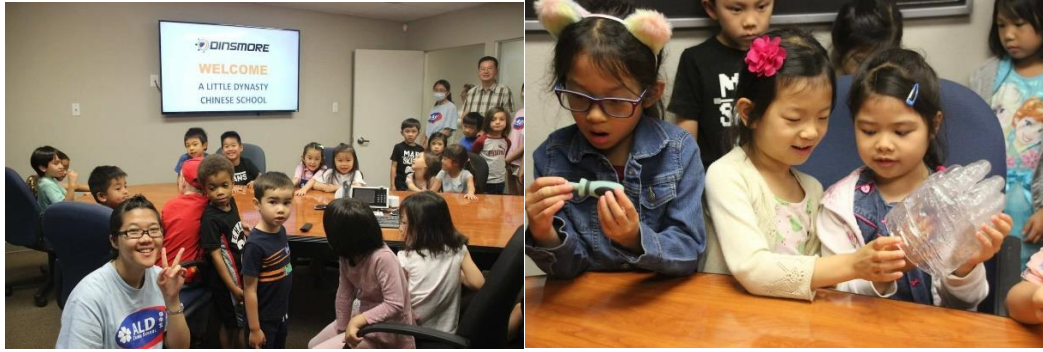
左圖，在工廠內聆聽工作人員介紹。/右圖，孩子傳閱 3D 列印出來的產品。