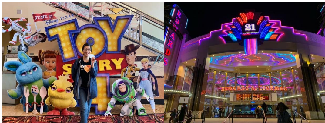
左圖，在美國看玩具總動員電影。/右圖，美國電影院外觀。

我們在美國看了兩場電影，體驗了美式電影院的感覺。這裡的裝潢充斥著霓虹燈，看起來金碧輝煌。