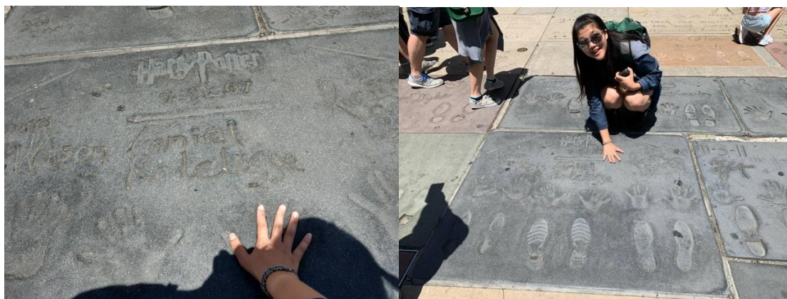
上圖，我與哈利波特電影演員群的手印合影。

我們走訪了好萊塢的星光大道、中國戲院以及好萊塢文字的著名地標。我也一圓夢想，與哈利波特主要演員群在中國戲院蓋下的手印合影。