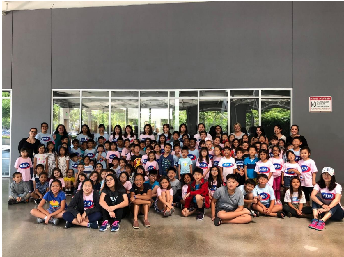
上圖，孩子們專心聆聽導覽員的解說。/下圖，全校大合照。