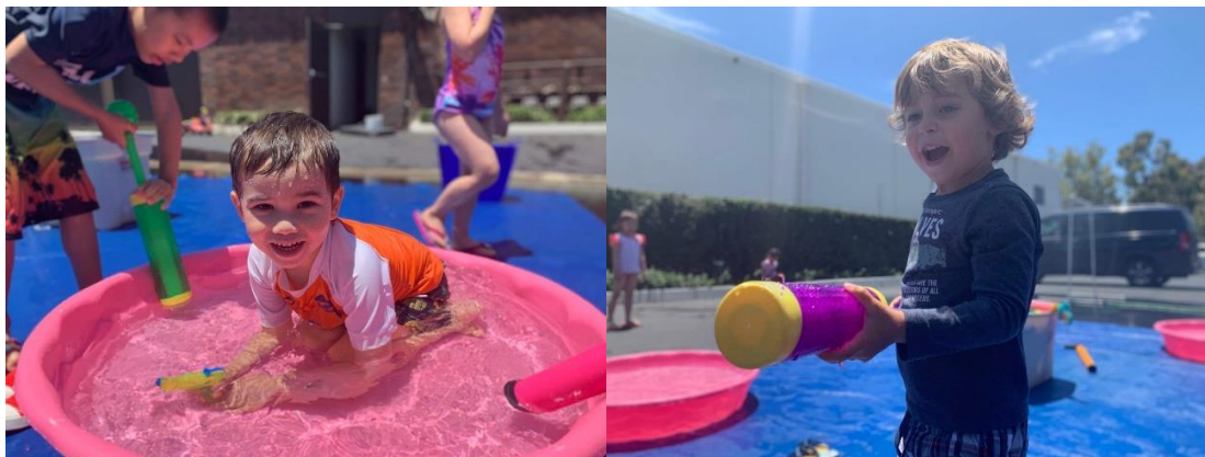
上圖，玩水的孩子們。