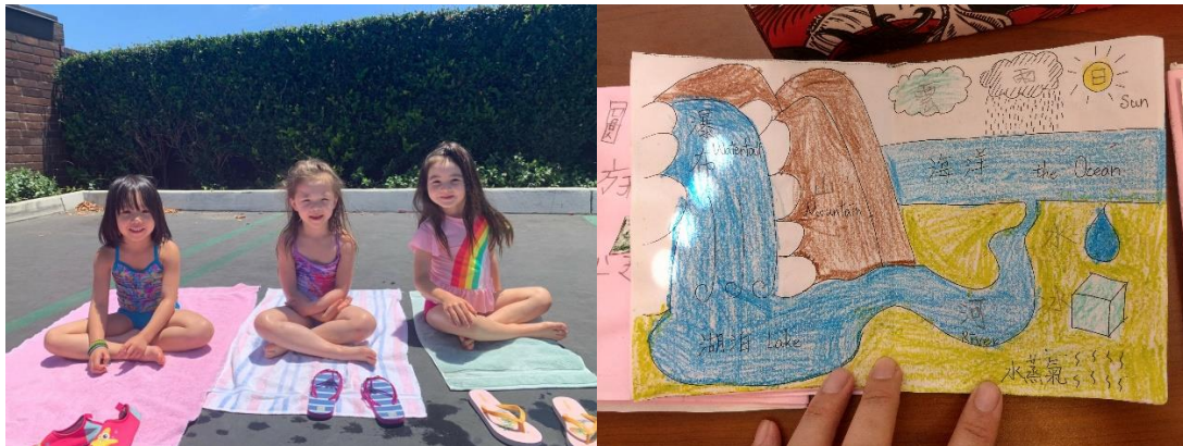
左圖，在玩水時間做日光浴的小女孩們。/右圖，與水有關的地景複習圖。(部分文字為小孩自己書寫)

在這個禮拜，我因應主題活動，以水為出發，教導了孩子水的三態、水循環及與水有關的各個地景的中文，讓孩子在每天下午主題活動出去玩水之餘，能夠學會跟水有關的中文。我也在上午帶領了跟水有關的小實驗，像是倒立杯、吸管水槍等。