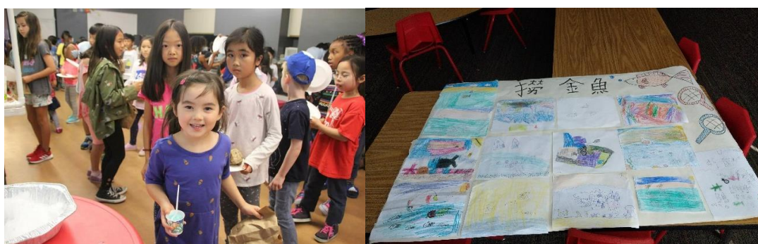
左圖，逛夜市的孩子們。/右圖，Beginner A 的夜市海報，圖文皆為孩子親自繪寫。