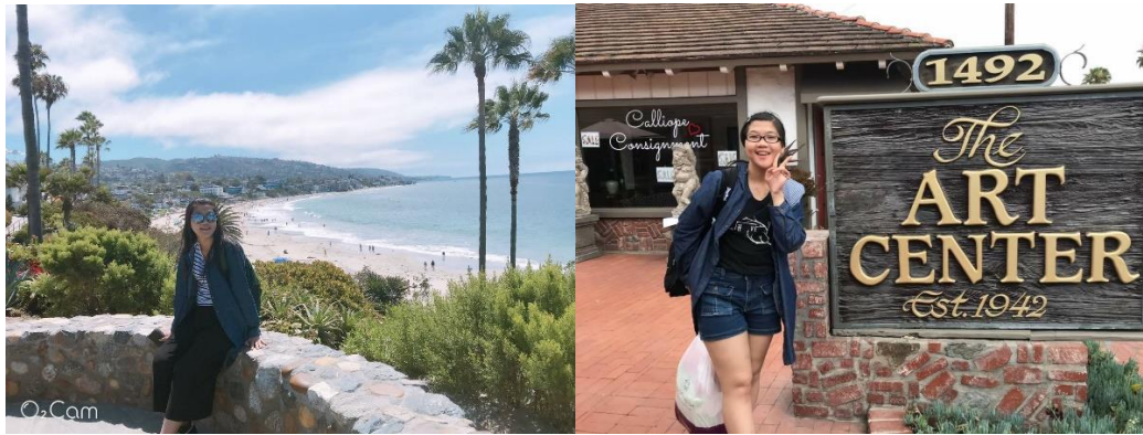
左圖，拉古納海灘。/右圖，拉古納海灘四週的藝術中心。