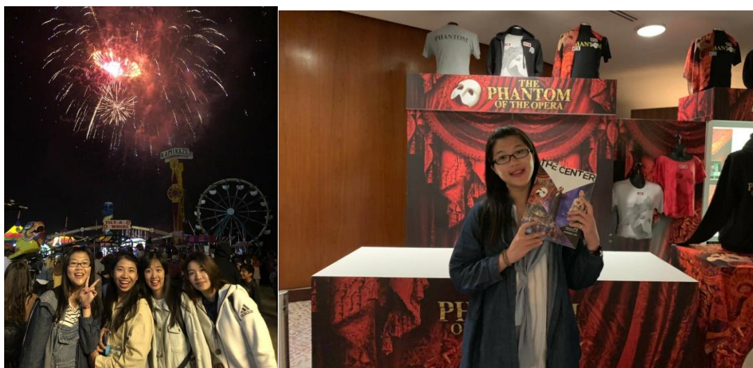
左圖，美國國慶日盛大的煙火。(最左為我)/右圖，觀賞音樂劇，歌劇魅影。

在實習期間，碰巧遇上了美國國慶日，學校放假一天，校長便帶著我們去當地的小樂園看煙火，感受了舉國同慶的盛況氛圍。